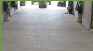
Stall, 7 år efter behandling.