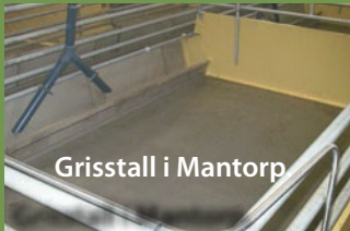
Grisstall i Mantorp

Slitstarkt, bakteriehämmande och lättstädat