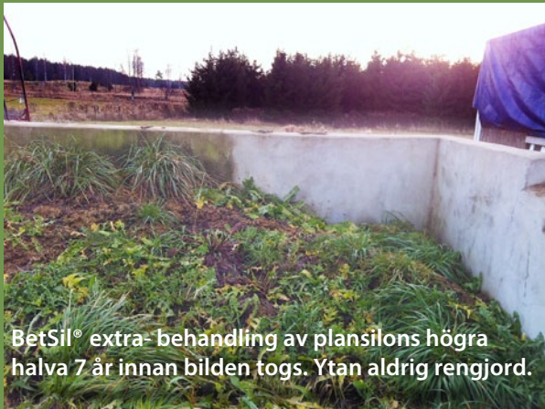
BetSil® extra-behandling av plansilons högra halva 7 år innan bilden togs. Ytan aldrig rengjord.